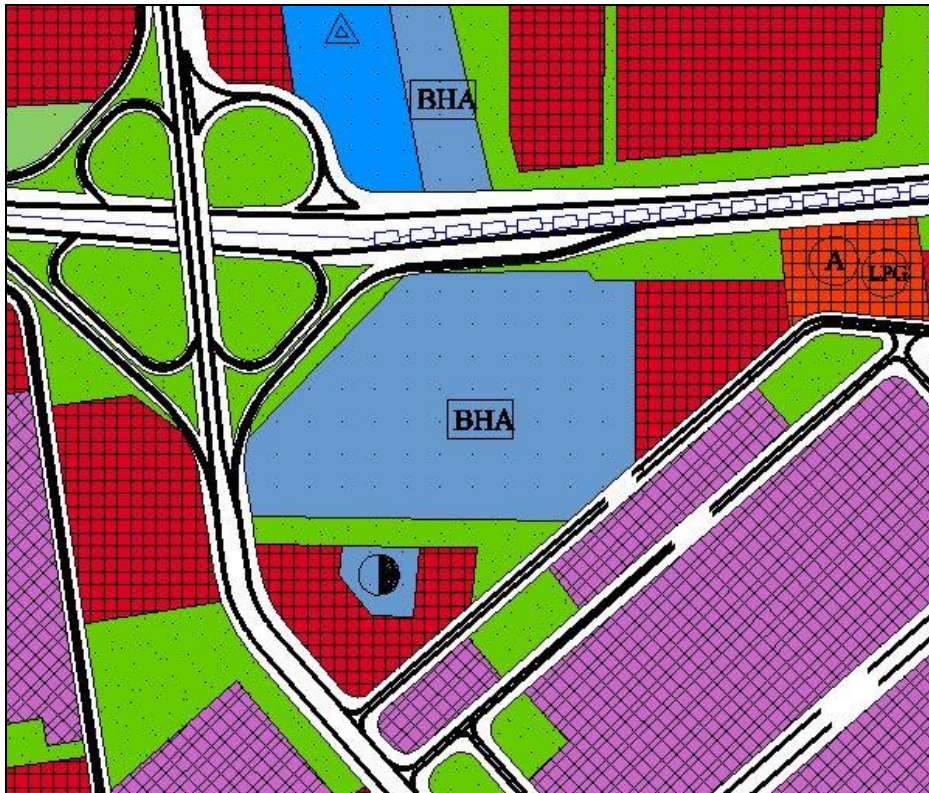
Onaylı 1/5000 ölçekli olan