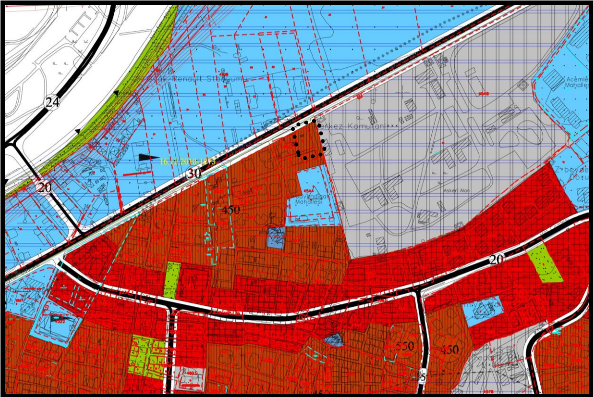
YÜRÜRLÜKTEKİ 1/5000 ÖLÇEKLİ OSMANGAZİ NAZİM İMAR PLANI ÖRNEĞİ