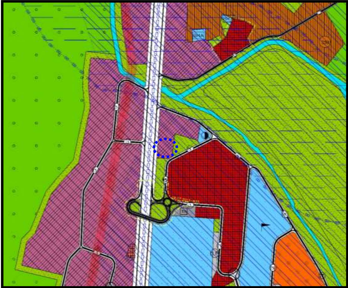
Yürürlükteki 1/5000 Ölçekli Osmangazi Belediyesi Nazım İmar Planı