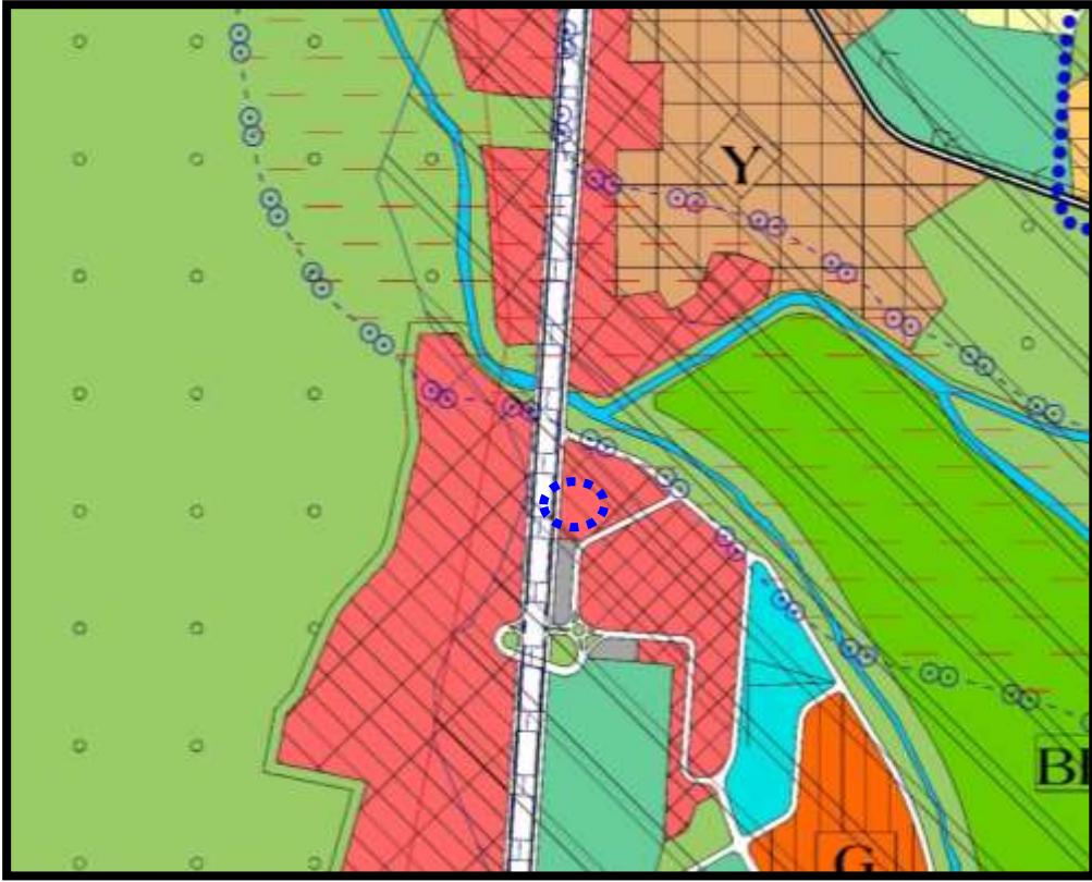
Yürürlükteki Bursa Büyükşehir Belediyesi Merkez Planlama Bölgesi 1/25000 Ölçekli Nazım İmar Planı Revizyonu