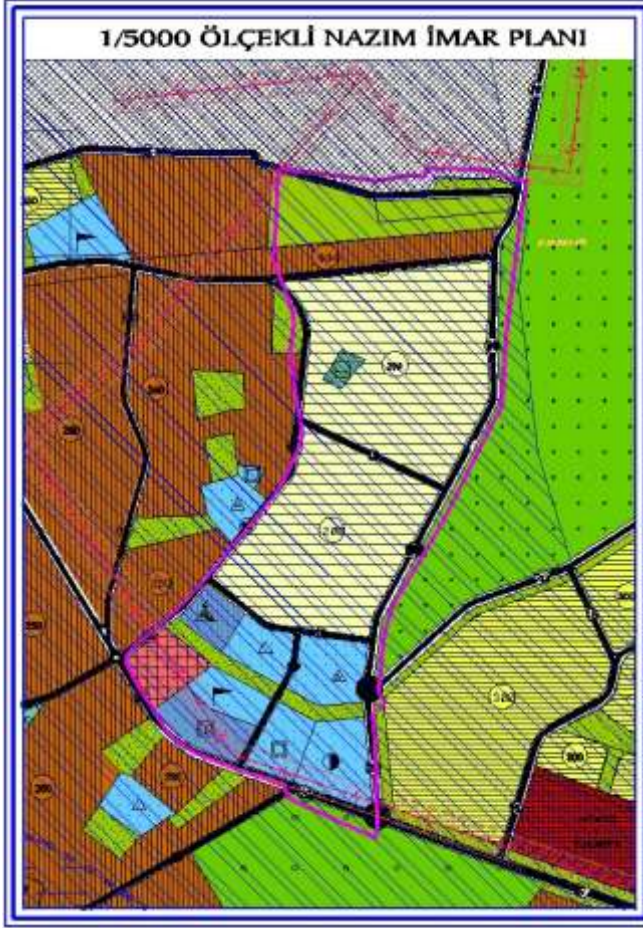
1/5000 ölçekli Nazım İmar Planı

Planlama alanı, onaylı 1/5000 ölçekli Nazım İmar Planı'nda 250 kişi/ha yoğunlukta Meskun Konut Alanında ve 200 kişi/ha yoğunlukta Gelişme Konut Alanında, ayrıca Pazar, Mezarlık, İlköğretim, Ortaöğretim, Sağlık Tesisi, Spor, Kültürel Tesis, Dini Tesis, Yönetim Merkezi Yeşil Alanda kalmaktadır.