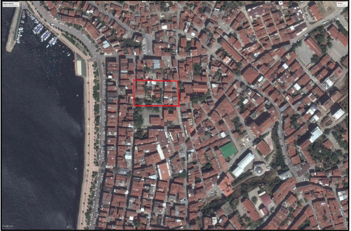
Planlama Alanı Hava Fotoğrafı

Plan değişikliği hazırlanan parseller konum olarak Mustafa Kemal Atatürk Kordonu Bulvarının 70 metre doğusunda, Atatürk İlköğretim Okulunun kuzeyinde ve Halk Eğitim Merkezinin batısında yer almaktadır. Plan değişikliği hazırlanan alan ve yakın çevresinde yapılaşmalar tamamlanmıştır.