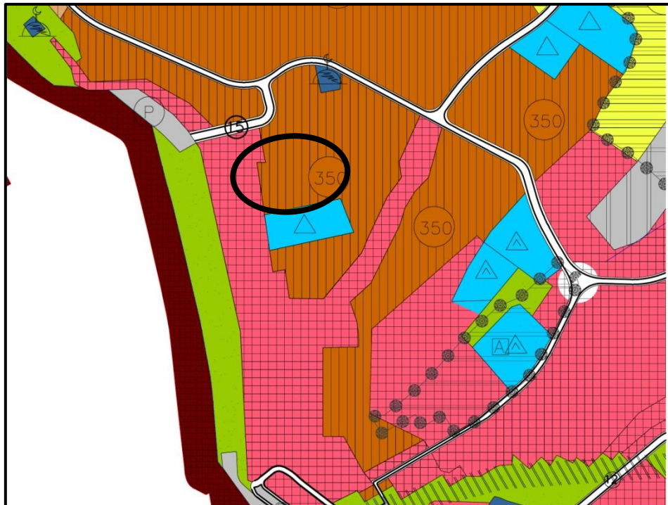
Onaylı 1/5000 Ölçekli Nazım İmar Planı Durumu

Planlama Alanı 1/5000 Plan Durumu: Plan deęiřiklięi hazırlanan Gemlik 1/5000 Ölçekli Nazım İmar Planında Orta Yoęunlukta (350 ki/ha) Meskun Konut Alanı olarak planlıdır.