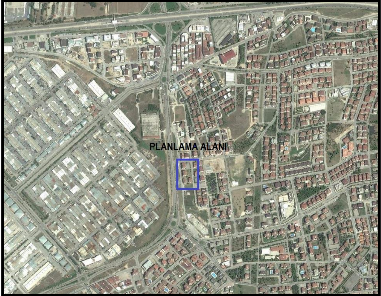
Şekil 1: Planlama Alanının Bölge İçerisindeki Konumu

Bursa İli, Nilüfer İlçesi, Beşevler Mahallesi'nde bulunan yaklaşık 4140,82 m 2 büyüklüğünde olan planlama alanı yakın çevresinde ağırlıklı olarak konut alanları, yeşil alanlar, ticaret alanları bulunmaktadır.