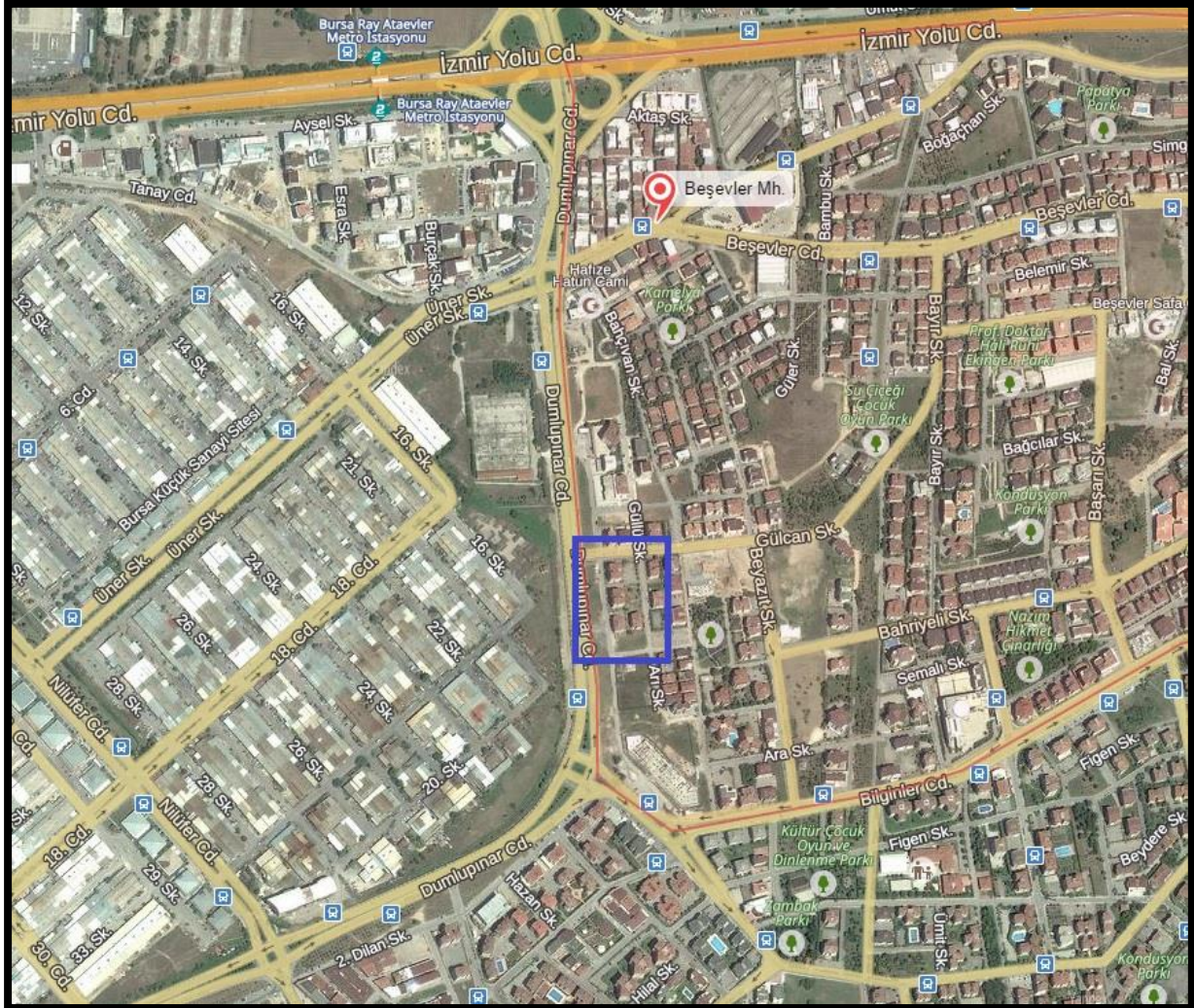
Şekil 2: Planlama Alanının Ulaşım İlişkileri