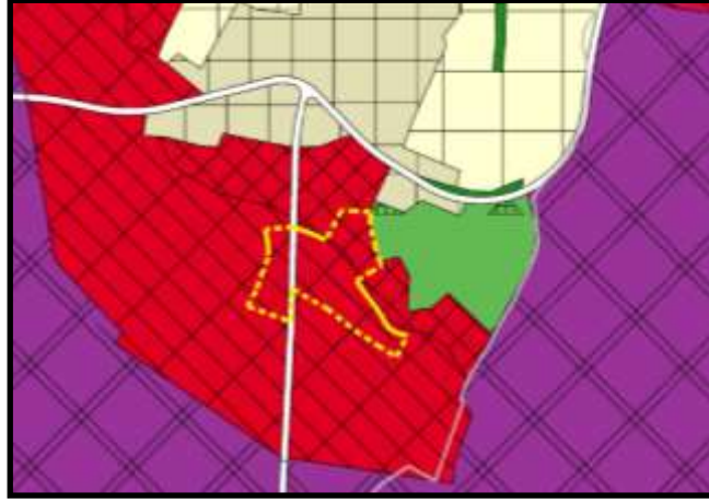
Onaylı 1/25000 Ölçekli Nazım İmar Planı Durumu

Planlama alanı 1/25000 plan durumu: Merkez Planlama Bölgesi 1/25000 Ölçekli Nazım İmar Planı kapsamında kalan söz konusu parseller “Konut Dışı Kentsel Çalışma Alanı” ve “Ticaret Alanı” olarak planlı durumdadır.