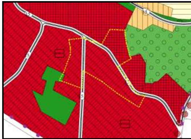
Onaylı 1/5000 Ölçekli Nazım İmar Planı Durum

Planlama alanı 1/5000 plan durumu: 1/5000 Ölçekli Osmangazi Belediyesi Nazım İmar Planı kapsamında kalan parseller “ Park Alanı, Ağa landırılacak Alan, Tali İş Merkezi Alanı ve Konut Dışı Kentsel Çalışma Alanında” kalmaktadır.