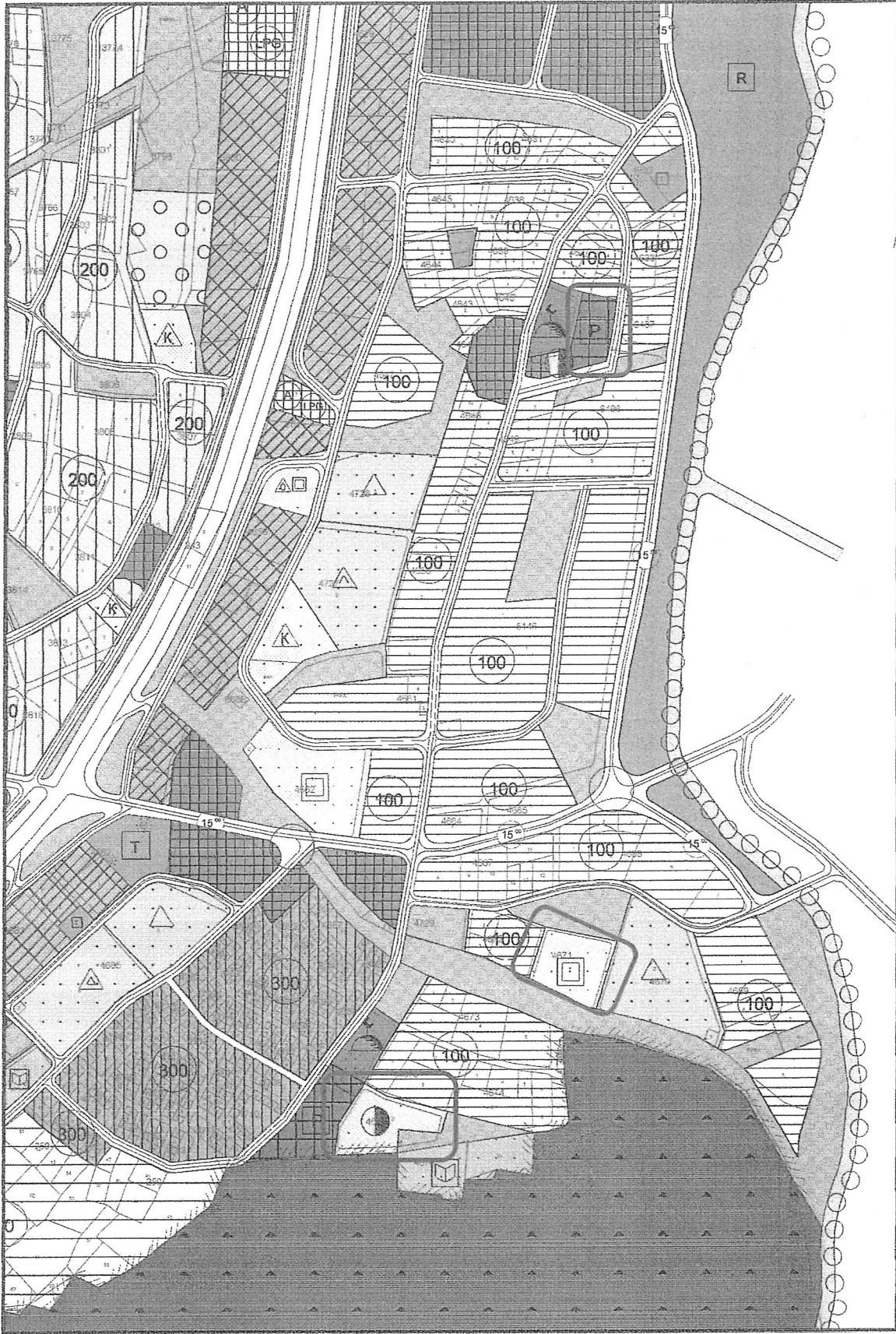
Resim 2. 1/5000 Ölçekli Nilüfer Nazım İmar Planı