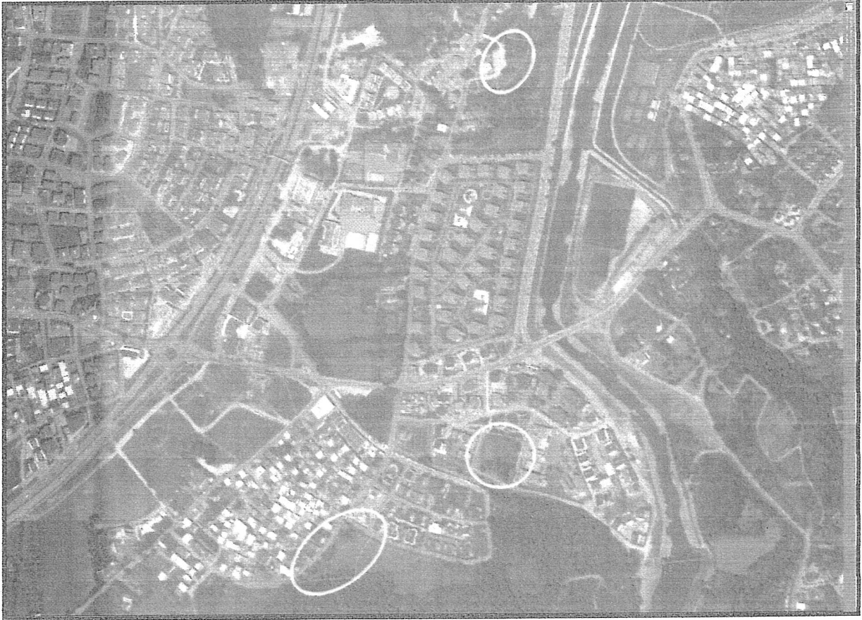
Resim 1. Uydu Görüntüsü

Plan değişikliği yapılan alan, Nilüfer İlçesi Odunluk Mahallesi sınırları içerisinde yer almaktadır. 2015 yılı TUİK verilerine göre Bursa İli Nilüfer İlçesi'nin toplam nüfusu 397.303 kişi olup, plan değişikliğinin yapıldığı Odunluk Mahallesi'nin 2015 yılı nüfusu ise 4776 kişidir.