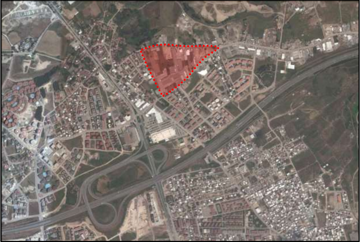
Plan Değişikliği Hazırlanan Alanın Uydu Görüntüsü

Geçit Mahallesi, Bursa Merkezinin kuzeybatısında ve Osmangazi İlçesi sınırları içinde bulunmaktadır. Söz konusu alan konumu itibariyle sanayi caddesi (Mudanya yolu)' nin 230 m kuzeydoğusunda, Bursa Çevre Yolu'nun 500 m kuzeybatısında yer almaktadır. 6343 adayı kapsayan alanda yapılan değişiklik 123818,53 m 2 büyüklüğündedir.