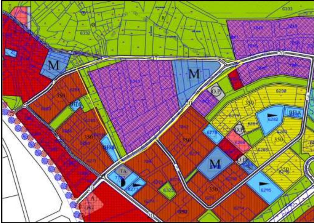
Onaylı 1/5000 Ölçekli Nazım İmar Planı