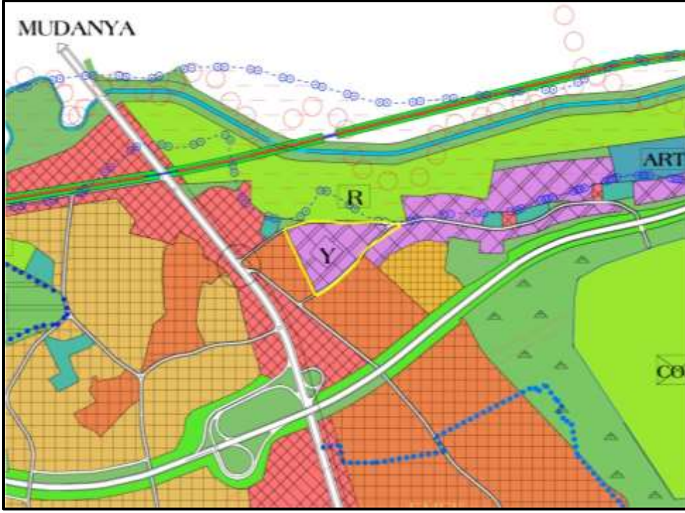
Onaylı 1/25000 Ölçekli Nazım İmar Plan