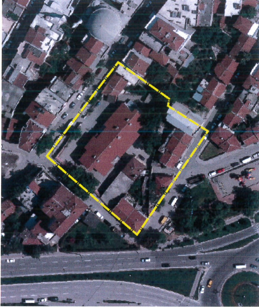
Resim 1: Alana ilişkin uydu görüntüsü

Plan değişikliğine konu alan yaklaşık 3600 m 2 olup, parselin bir kısmı maliye hazinesi, bir kısmı büyükşehir belediyesi , bir kısmı da özel mülkiyetten oluşmaktadır.