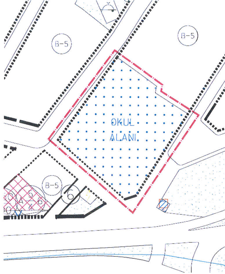
Resim 3: Onaylı 1/1000 Ölçekli Elmasbahçeler Gökdere Uygulama İmar Planı

Bursa Osmangazi Belediye Meclisi'nin 21.08.2002 gün ve 301 sayılı kararı ile uygun görülmüş, Bursa Büyükşehir Belediye Başkanlığı'nca 25.10.2002 gün ve 16021085/263 sayı ile onaylanan 1/1000 Ölçekli Elmasbahçeler Gökdere 1/1000 ölçekli uygulama imar planında “Okul Alanında” yer almaktadır.