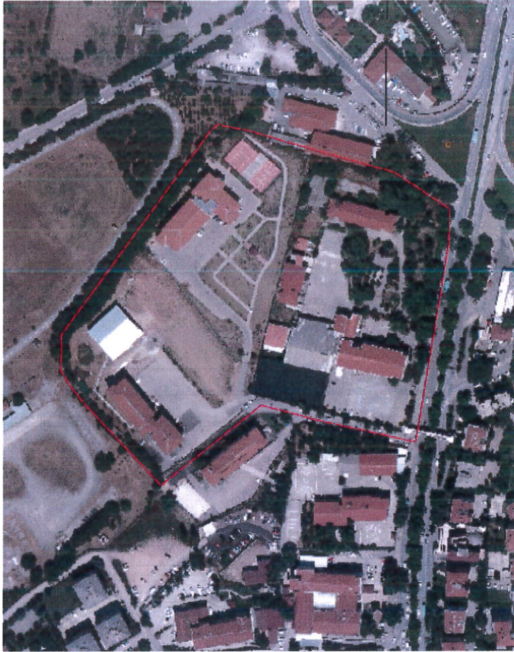
Resim 1: Alana ilişkin uydu görüntüsü

Plan değişikliğine konu alan yaklaşık 42236 m 2 olup, parsel maliye hazinesi mülkiyetinden oluşmaktadır.