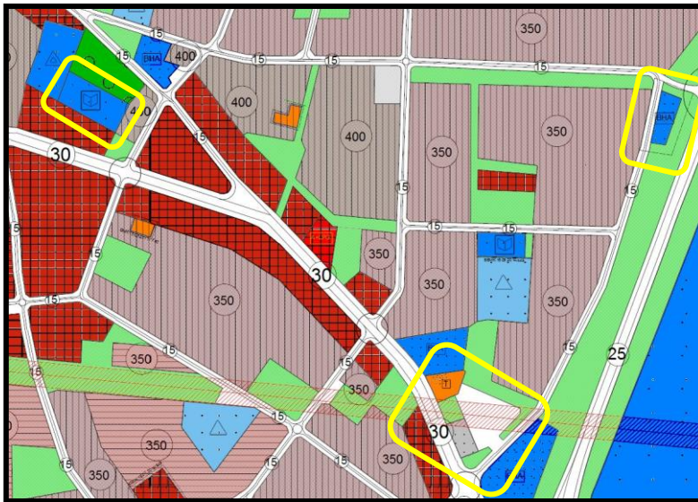
Resim 2. 1/5000 Ölçekli Görükle Nazım İmar Planı