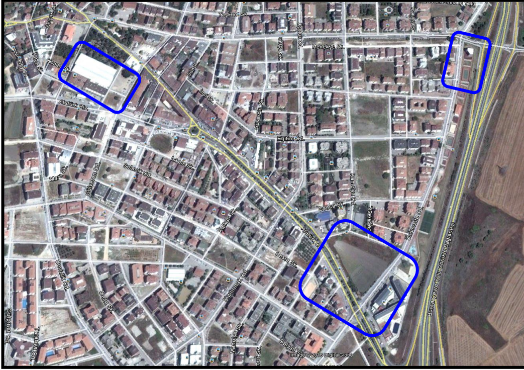
Resim 1: Uydu Görüntüsü

Plan değişikliği yapılan alan, Nilüfer İlçesi Görükle Mahallesi sınırları içerisinde yer almaktadır. 2015 yılı TÜİK verilerine göre Bursa İli Nilüfer İlçesi'nin toplam nüfusu 397.303 kişi olup, plan değişikliğinin yapıldığı Görükle Mahallesi'nin 2015 yılı nüfusu ise 15.934 kişidir.