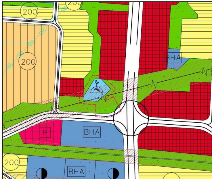
Resim 2: 1/5.000 ölçekli Nilüfer Nazım İmar Planı:

1/5000 ölçekli Nilüfer Nazım İmar Planı'na göre Nilüfer İlçesi, 29 Ekim Mahallesi, 2374 ada3 parsel "Dini Tesis Alanı", 2374 ada 4 parsel ise "Park ve Dinlenme Alanı" olarak ayrılmıştır.