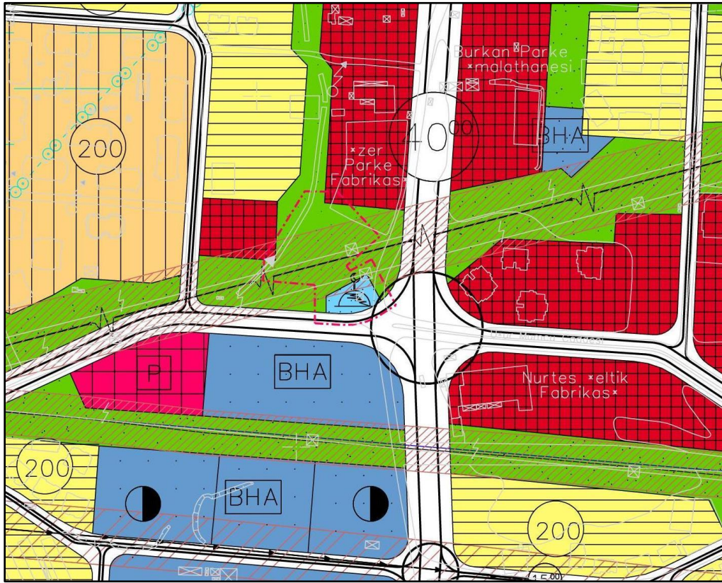
Resim 3: 1/5.000 ölçekli Nilüfer Nazım İmar Plan Değişikliği:

Plan değişikliği önerilen alana ait kullanımların dağılımı şu şekildedir: