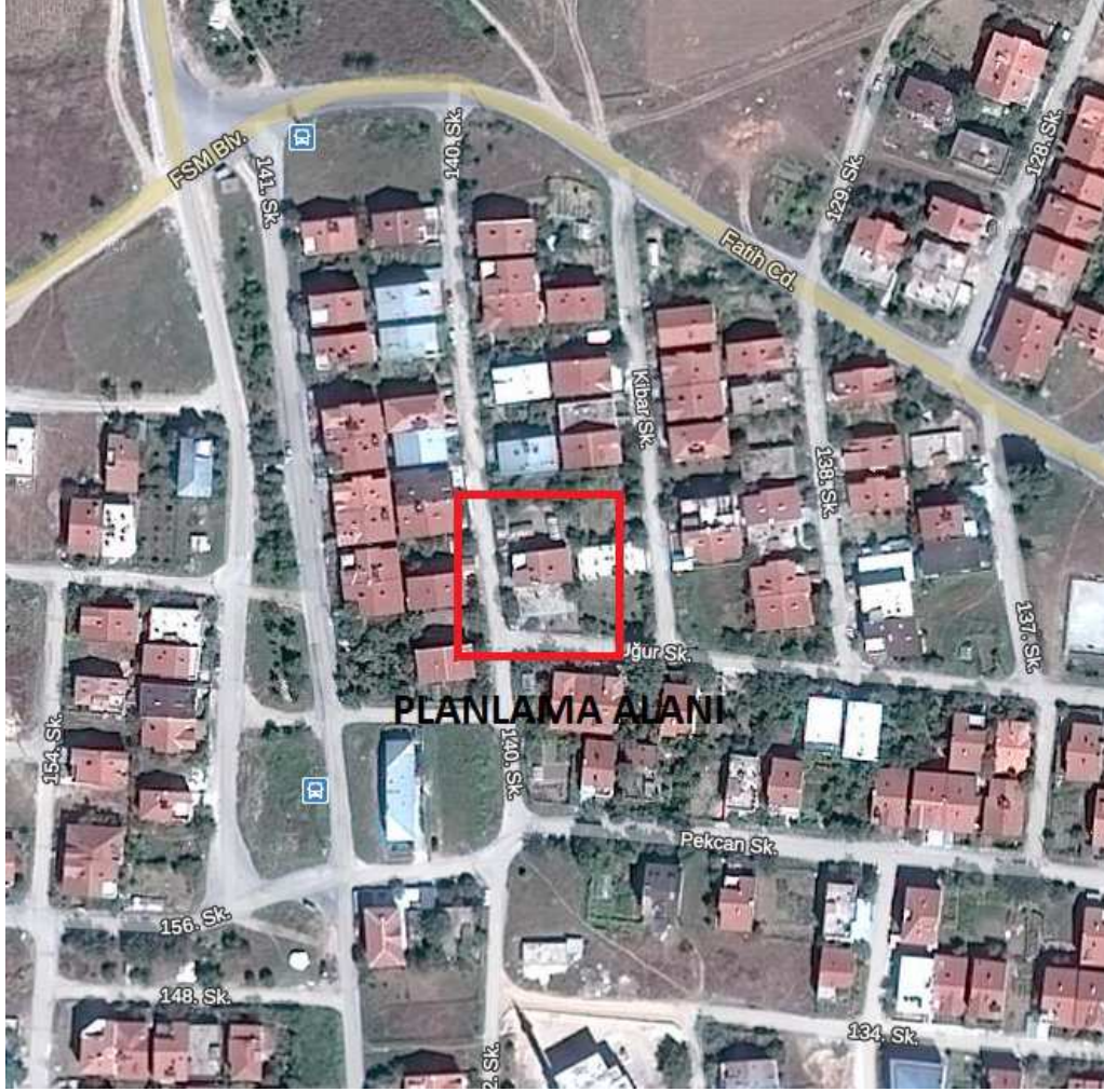
Şekil 2: Planlama Alanının Ulaşım İlişkileri