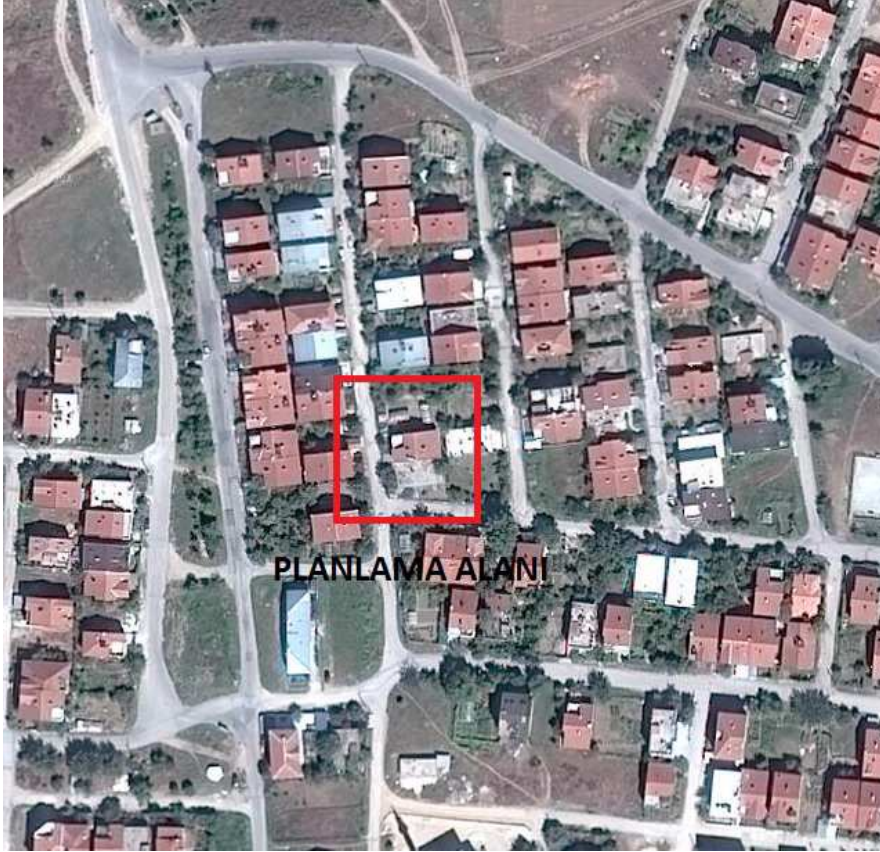
Şekil 1: Planlama Alanının Bölge İçerisindeki Konumu

Bursa İli, İnegöl İlçesi, Akhisar Mahallesinde bulunan yaklaşık 462.11 m 2 büyüklüğünde olan planlama alanı yakın çevresinde ağırlıklı olarak konut ve park alanları bulunmaktadır.