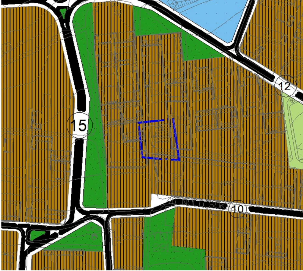
Şekil 5:213 Ada 13-14 Sayılı Parsele İlişkin 1/5000 Ölçekli Nazım İmar Planı Tadilatı