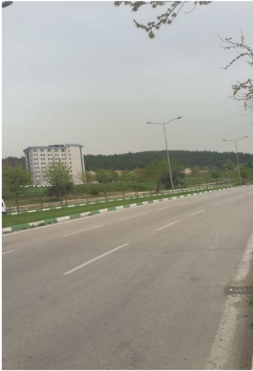
Fotograf 1: Planlama Alanının Görünüşü-1

Planlama alanı, mevcutta bina bulunmaktadır. Çevresi ağırlıklı olarak Konut Alanları, Eğitim Tesisi Alanları ile Konut Dışı Kentsel Çalışma Alanları olarak planlıdır