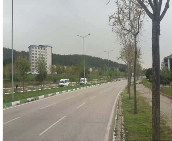
Fotograf 2: Planlama Alanının Görünüşü-2