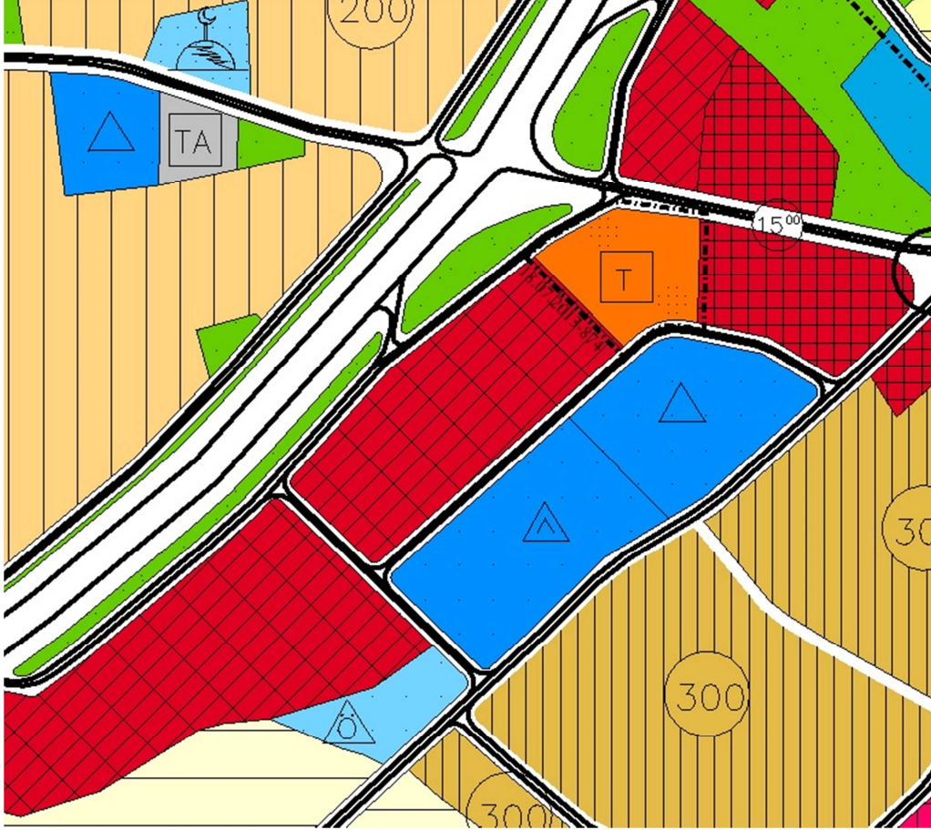
Şekil 4: 1/5000 ölçekli Nazım İmar Planı Durumu

Planlama alanına ait planlama kararları incelendiğinde 1/5000 Ölçekli Nazım İmar Planında planlama alanı "Konut Dışı Kentsel Çalışma Alanında" kalmaktadır.