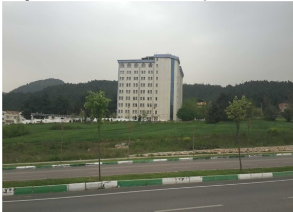
Fotograf 3: Planlama Alanının Görünüşü-3