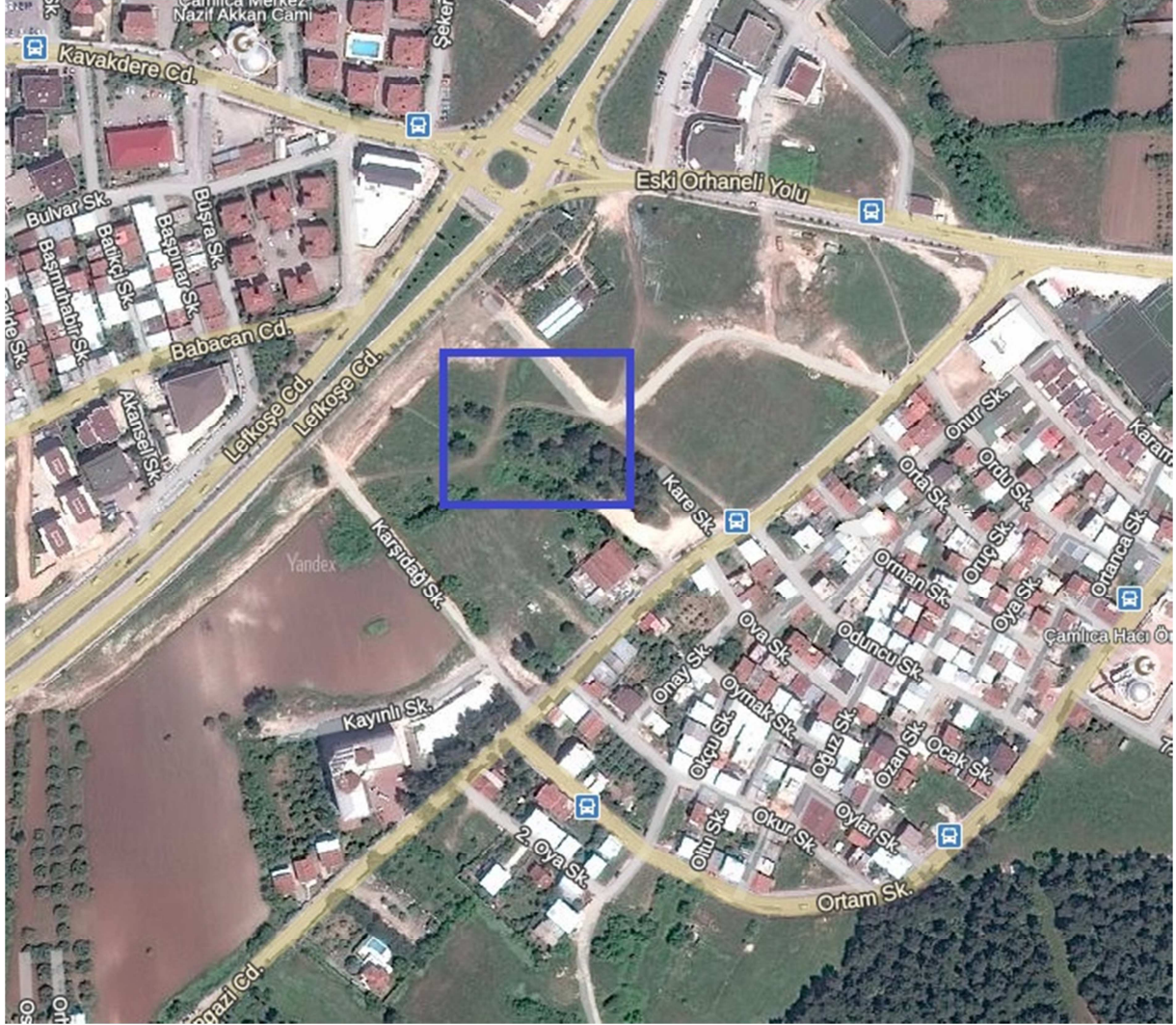
Şekil 2: Planlama Alanının Ulaşım İlişkileri