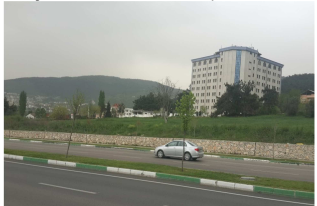
Fotograf 4: Planlama Alanının Görünüşü-4