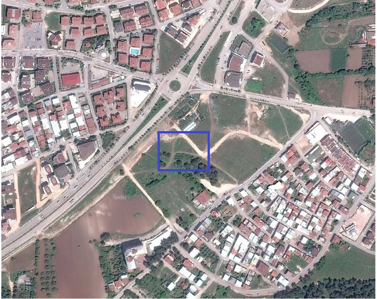
Şekil 1:Planlama Alanının Bölge İçerisindeki Konumu

Bursa İli, Nilüfer İlçesi, Odunluk Mahallesi içinde bulunan 855.6 m 2 büyüklüğünde olan planlama alanın kuzeyinde Kare Sokak , doğusunda Kalemli Sokak bulunmaktadır.