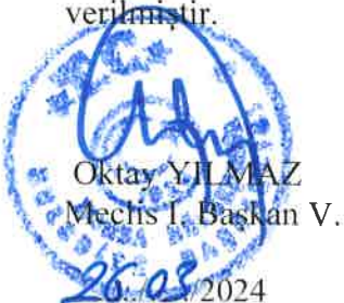
Oktay YILMAZ Meclis I. Başkanı V.

3194 sayılı İmar Kanunu'nun 8/b ve 5216 sayılı Büyükşehir Belediyesi Kanunu'nun 7/b maddeleri uyarınca raporun aynen kabulüne Büyükşehir Belediye Meclisinin, 19.03.2024 günlü OLAĞAN toplantısının 2. Birleşiminde yapılan işaretle oylamada mevcudun oybirliği ile karar verilmiştir.