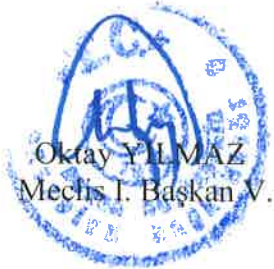
Oktay YILMAZ Meclis I. Başkanı V.

3194 sayılı İmar Kanunu'nun 8/b ve 5216 sayılı Büyükşehir Belediyesi Kanunu'nun 7/b ve 14. maddeleri uyarınca raporun aynen kabulüne Büyükşehir Belediye Meclisinin, 19.03.2024 günlü OLAĞAN toplantısının 2. Birleşiminde yapılan işaretle oylamada mevcudun oybirliği ile karar verilmiştir.