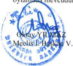
Oktay YILMAZ Meclis L. Başkanı V.

Konunun Mecliste görüşülmesi sonucunda; Raporun aynen kabulüne Büyükşehir Belediye Meclisinin, 19.03.2024 günlü OLAĞAN toplantısının 2. Birleşiminde yapılan işaretle oylamada mevcudun oybirliği ile karar verilmiştir.