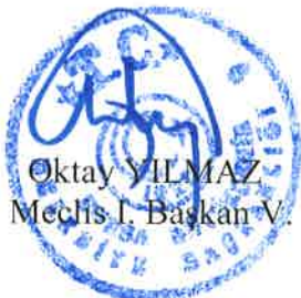
Oktay YILMAZ Meclis I. Başkan V.

3194 sayılı İmar Kanunu’nun 8/b ve 5216 sayılı Büyükşehir Belediyesi Kanunu’nun 7/b maddeleri uyarınca raporun aynen kabulüne Büyükşehir Belediye Meclisinin, 19.03.2024 günlü OLAĞAN toplantısının 2. Birleşiminde yapılan işaretle oylamada mevcudun oybirliği ile karar verilmiştir.