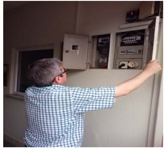
ACİL ÇIKIŞ YÖNLENDİRME LEVHASI MONTAJI - ELEKTRİK TESİSAT KONTOLÜ

d- Bina ve yerleşkelerde bulunan, sulu söndürme sistemlerin ( yangın dolapları, hidrant sistemi, yağmurlama sistemi, itfaiye su verme bağlantısı) yıllık periyodik kontrollerini hazırlamış olduğumuz form dahilinde yapmak ve yaptırtmak, arızalı olanları faal hale getirmek.