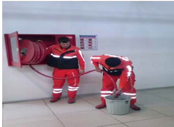
YANGIN DOLAPLARIN KONTROLÜ

e- Sivil Savunma Uzmanlığının envanterinde görülen ve hizmet binalarımızın değişik yerleşkelerinde bulunan 1900 adet çeşitli cins ve ebatta taşınabilir yangın söndürme cihazlarının yılda bir kontrolleri ve dört yılda bir testleri ile birlikte dolumlarının yaptırılmasını sağlamak, (2014 yılının son aylarında dolumları yapılmıştır.)