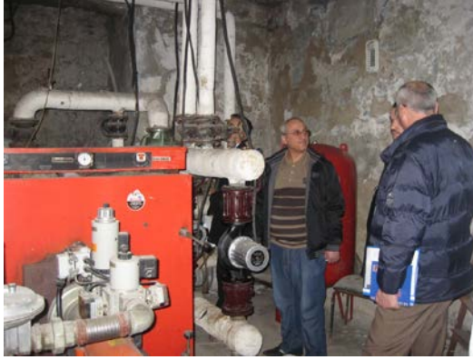
KAZAN DAİRELERİNİN KONTROLÜ

a- Belediyemiz bina ve müştemilatlarında mevcut bulunan kazan daireleri ile ilgili yıllık periyodik baca kontrollerinin yaptırılmasını sağlamak, kazan daireleri, çay ocakları, mutfakların yönetmelik gereğince, bulunması mecburi olan gaz algılama cihazları, selonait vana bağlantılarının kontrollerini yapmak, arızalı olanların tamirini yaptırmak, eksik olan yerlere ise tesis edilmesini sağlamak/ sağlamak. Ayrıca kazan dairelerinde görev yapan ateşleyici belgesi bulunan personele her yıl eğitim vermek.