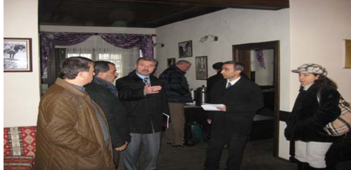
TARİHİ BİNALARIN DENETİMİ

h- Binaların Yangından Korunması Hakkındaki Yönetmelik gereğince, Belediyemiz bünyesinde faaliyet göstermekte olan tarihi özelliğe haiz binalar hakkında oluşturulan komisyon tarafından gerekli denetimleri yapmak ve hazırlanan sonuç raporunu ilgili birimlere göndermek ve sürecin takibini sağlamak,