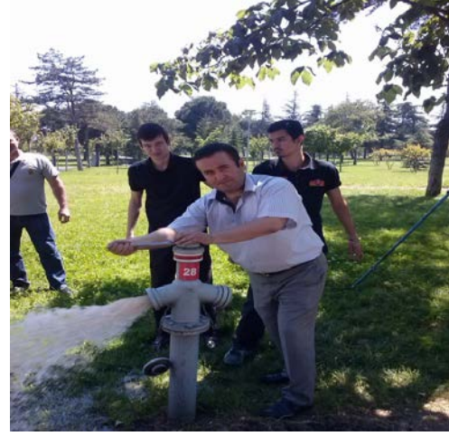
HİDRANTLARIN BAKIM VE KONTROLLERİ