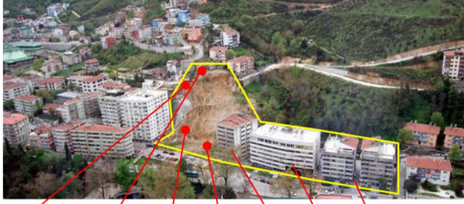
Tezcan Apt. ve Gecekondular (4276-1) Baro evleri A Blok (4178-1) İntam 95 (4162-7) İntam 97 (4162-6) İntam 99 (4162-5) İntam 101 (4162-3) Urgancıoğlu Apt (4162-2)