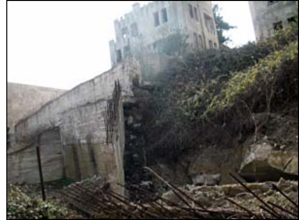
03.02.2010 Tarihinde Kayan Göynüklü Yolu