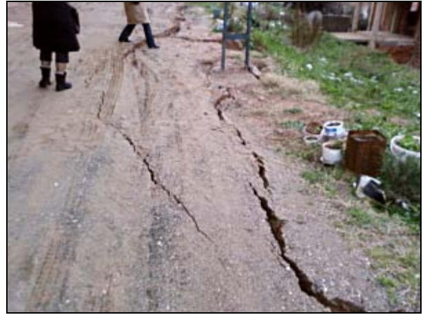
Güzelyalı Kızıltoprak Mevkii Heyelan Bölgesi