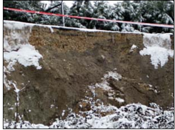
03.02.2010 Tarihinde Kayan Göynüklü Yolu