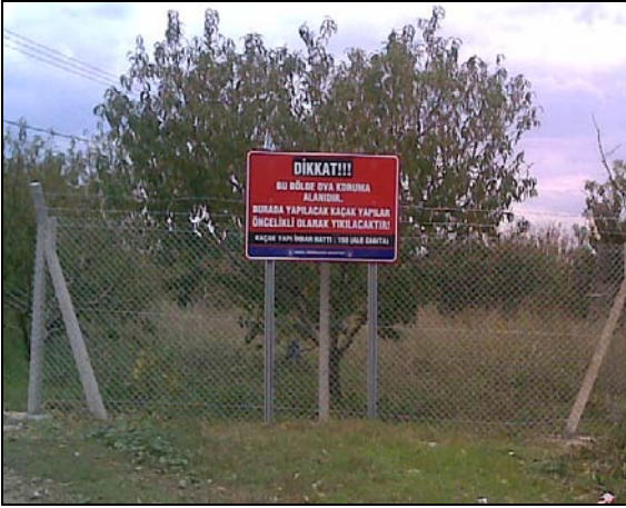
Mehmet Akif Mahallesi Telçit Uygulaması