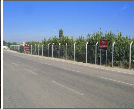
Yakın Doğu Çevre Yolu Telçit ve Sac Uyarı Tabelası Uygulaması