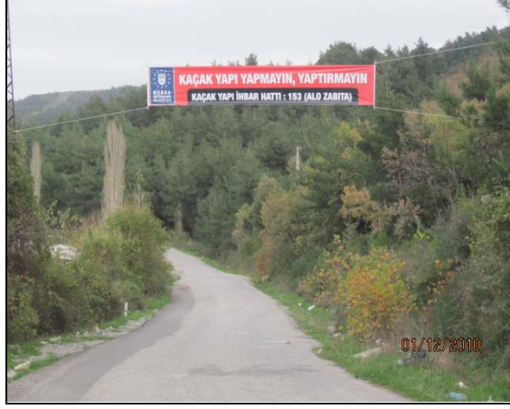
Kırsal Bölge Kaçak Yapı Uyarı Afışı