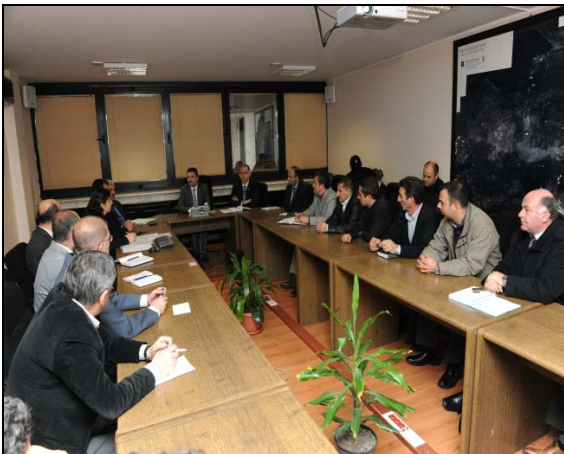
09.03.2010 Tarihinde Yapılan Kaçak Yapılar ile Mücadelede Beton Firmaları ile İşbirliği ve Çalışma Esaslarını Belirleme Konulu Toplantı