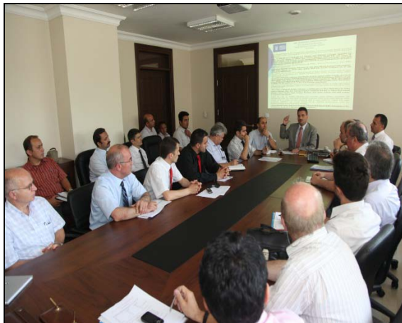
06.07.2010 Tarihinde Yapılan Kaçak Yapılar ile Mücadelede Altyapı Kuruluşları ile İşbirliği ve Çalışma Esaslarını Belirleme Konulu Toplantı