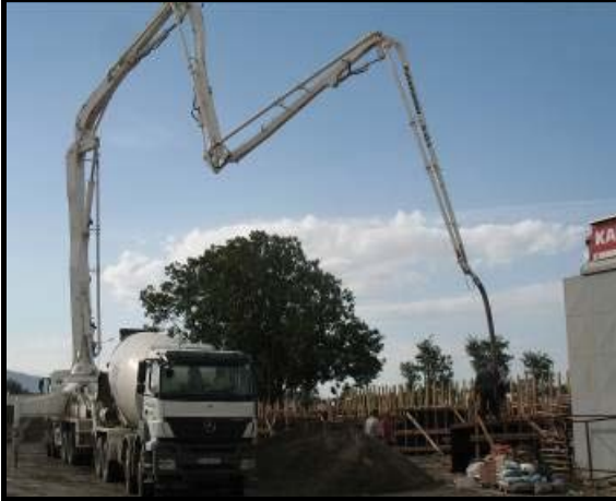
Plansız Alanda Beton Dökümü Tespiti