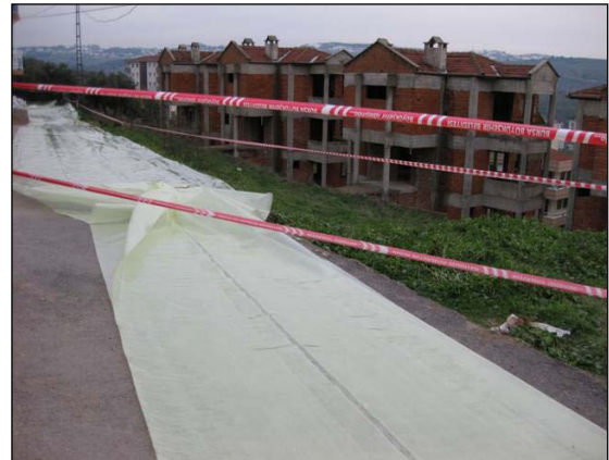
Güzelyalı Kızıltoprak Mevkii Heyelan Bölgesi