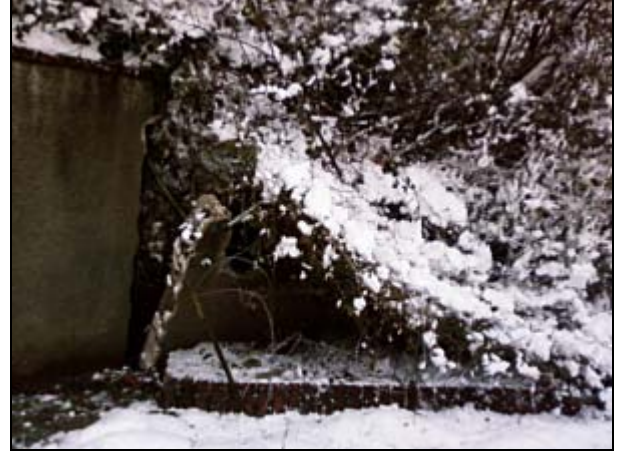
Seçtepe Mevkii Kayan Yol