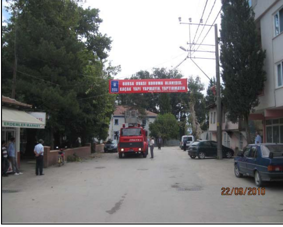
Ova Bölgesi Kaçak Yapı Uyarı Afışı