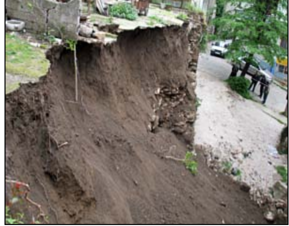
Gemlik Kayhan Mah. Yıkılan Sur Duvarı